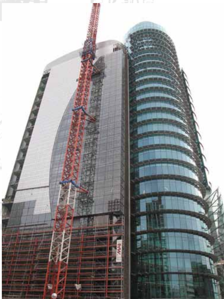
Torre Titania. Madrid

50 años de experiencia, más de 100 años de tradición familiar