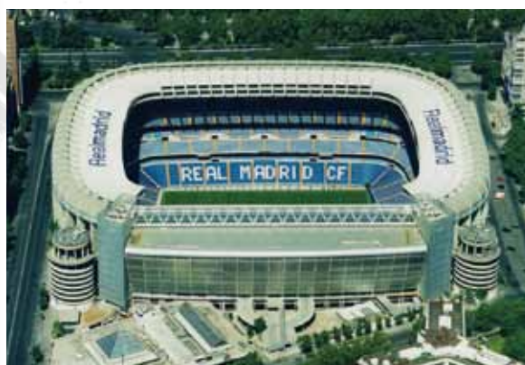
Estadio Santiago Bernabéu