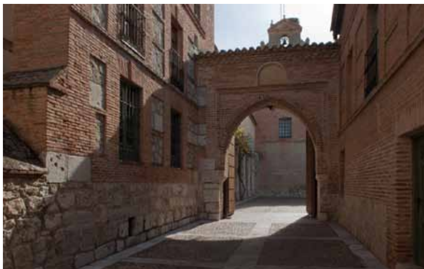
Entrada de visitantes al Real Monasterio de Santa Clara, Tordesillas

Con el fin de unificar la actuación, se diseñó un único modelo de rampas con pequeñas modificaciones según los condicionantes. Se escogió la madera como material principal, en consonancia con los materiales del conjunto.