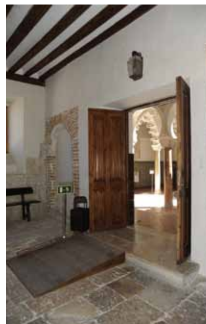
Acceso al patio árabe