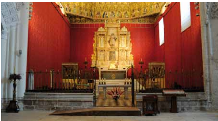
Bajo estas líneas: rampa de acceso al altar de la iglesia