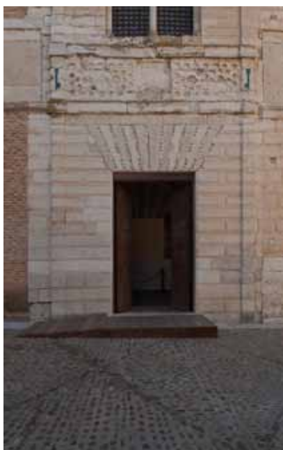
Rampa de acceso al vestíbulo del antiguo palacio mudéjar

Para descender a la sala principal, existen dos escalones que se salvan gracias a una rampa de 100 cm de ancho. Después, es necesario atravesar la sala principal para salir de la antigua zona de caballerizas. Tras un primer tramo horizontal, el suelo as-