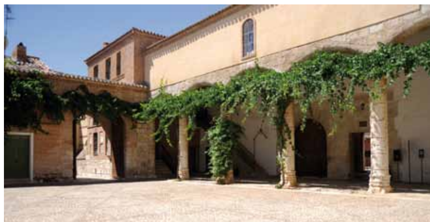
Compás del convento

Para salvar alturas de hasta 10 cm se proyectaron rampas únicamente de madera y a partir de esa cota se colocaron pletinas perimetrales metálicas de borde y remate. La pendiente se fijó en un 10 % dadas las limitaciones de espacio, aunque se trató de man-