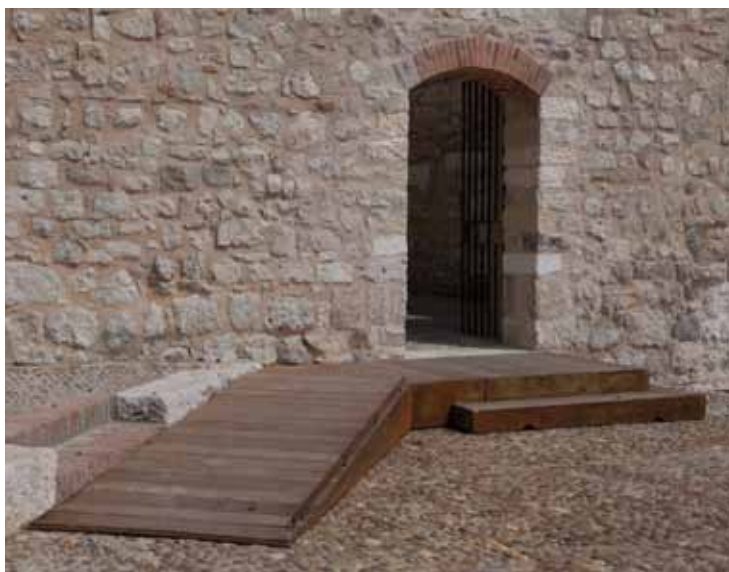
A la izda.: acceso al patio previo de los baños árabes

La entrada a los baños a través del cuarto frío tiene dos escalones con un desnivel total de 30 cm, que se salvaron colocando una rampa que abarcaba todo el hueco del paso. Tras este cuarto, y girando 90° se accede al cuarto templado o principal que da paso al cuarto caliente. Esta habitación intermedia se encuentra 18 cm por debajo de las otras dos, por lo que se instaló una plataforma horizontal en forma de L desde un vano a otro, dejando el centro libre para no invadir la estancia. Tras acceder al cuarto caliente, que se asoma a la leñera, concluye la visita y se hace el itinerario de forma inversa para dirigirse de nuevo al centro de recepción de visitantes. ROP