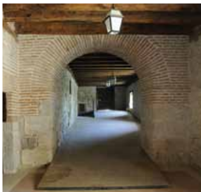
Rampa que salva una escalera veneciana en la antigua zona de caballerizas