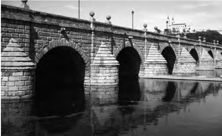
Fig. 12. Puente de Segovia en Madrid sobre el río Manzanares. Juan de Herrera. 1589. Fig. 13. Puente de Torrelodones sobre el río Guadarrama. Juan de Herrera.