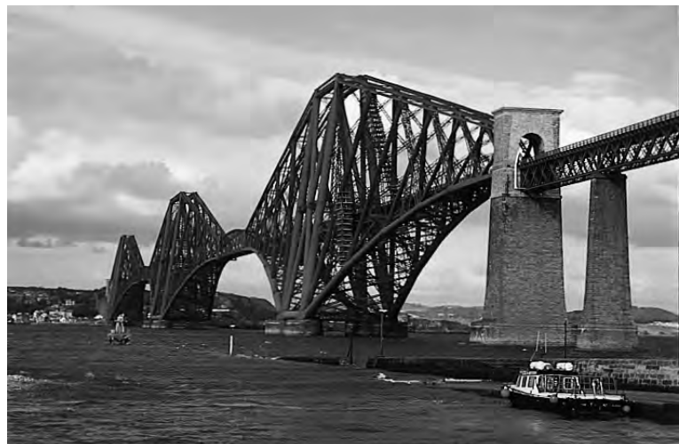
Fig. 24. Puente del Firth of Forth, Escocia. 1890. J. Fowler y B. Baker. Luz 521 metros.

En el siglo XIX, probablemente el más brillante de la ingeniería civil, se produjo un espectacular desarrollo de todas las ramas de la ingeniería. Centrándonos en la construcción, la aparición del hierro, nuevo material, y conocer el comportamiento resistente de las estructuras, dieron lugar a su espectacular desarrollo. Entre el Puente de Coalbrookdale , el primer puente metálico, de 30 me-