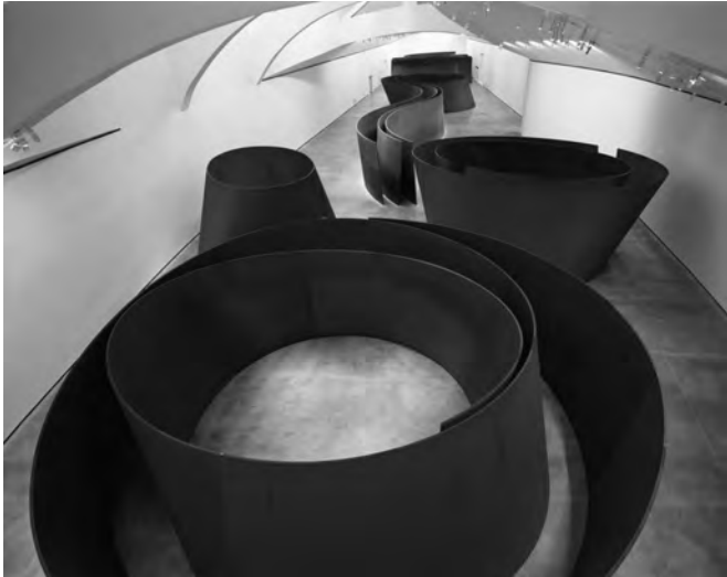
Fig. 1. Richard Serra, La Materia del Tiempo. Museo Guggenheim. Bilbao.