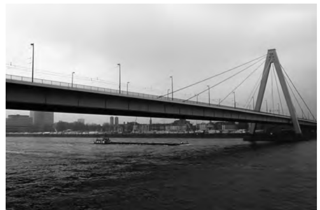
Fig. 35. Puente Severin sobre el Rin en Colonia. 1962. Arq. G. Lohmer. Luz 301 m.