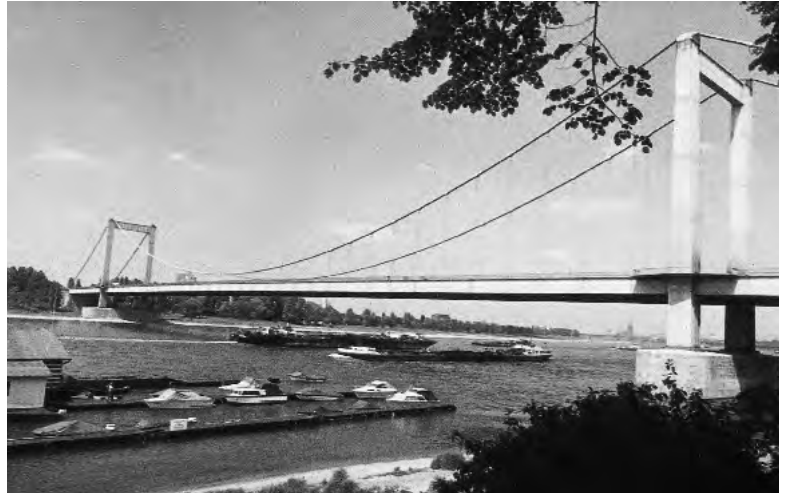
Fig. 33. Puente de Rodenkirchen sobre el Rin. Alemania. 1941. F. Leonhardt Ing. P. Bonatz Arq. Luz 370 m.

Mucho se ha escrito y mucho se puede decir de la colaboración entre arquitectos e ingenieros, y ya nos hemos referido a los ingenieros FAZLUR KHAN, LESLIE ROBERTSON, OVE ARUP, EDMUND HAPPOLD y PETER RICE cuya labor profesional ha sido hecha casi enteramente en colaboración con arquitectos. Pero nos vamos a referir ahora a la intervención de los arquitectos en las obras de ingeniería y más concretamente en los puentes.