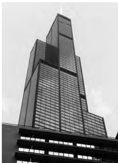
Fig. 11. Edificio Sears. Chicago.

ban en universidades, los que aprendían con otro arquitecto o ingeniero, o los que procedían de maestros canteros.