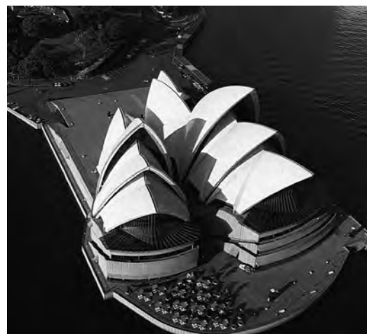
Fig. 8. Ópera de Sydney. J. Utzon Arq. Over Arup & Partners Ings. Fig. 9. Cúpula de Santa María del Fiore. Florencia. F. Brunelleschi. S. XV.

Vamos a hacer una revisión histórica de la relación de ambas profesiones, orientada principalmente hacia el in-