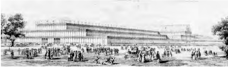
Fig. 25. Cristal Palace. Londres. Paxton. 1851.

tros de luz, y el Puente de Firth of Forth de 521 metros de luz, transcurre poco más de un siglo, exactamente 111 años. Pero este rápido desarrollo de la ingeniería civil creó también problemas y desajustes. Las dificultades técnicas que se planteaban en los puentes y en las estructuras, eran cada vez mayores, y por ello los ingenieros del siglo XIX, dedicaron su mayor atención a estos problemas, olvidando con frecuencia, e incluso despreciando en ocasiones, el proceso creativo que lleva a una buena obra que, si bien es inseparable del proceso resistente, va más allá de él.