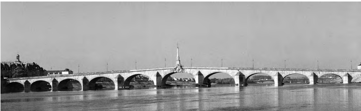
Fig. 19. Pont Gabriel sobre el Loira en Blois. Jaques V Gabriel. S. XVIII.

A mediados del siglo XVIII se iniciaron en Europa los cuerpos de ingenieros civiles, y poco tiempo después las escuelas correspondientes de formación de ingenieros. En 1716 se creó en Francia el cuerpo de Ingenieurs des Ponts et Chaussées , a partir de los arquitectos al servicio del Rey. El primer premier ingénieur fue JACQUES