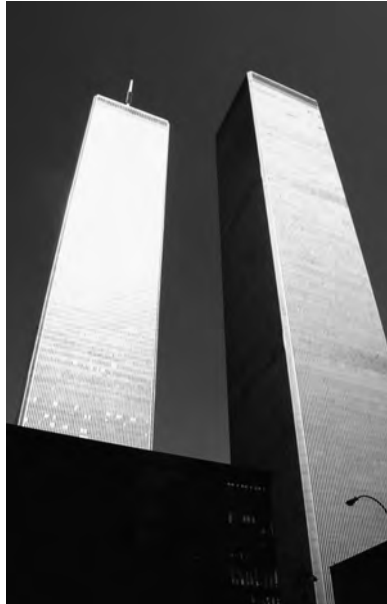
Fig. 10. Torres gemelas. Nueva York.

Es difícil en este periodo identificar a los ingenieros y a los arquitectos, porque los diferentes profesionales dedicados al arte de construir tenían muy diversas procedencias: los que estudia-