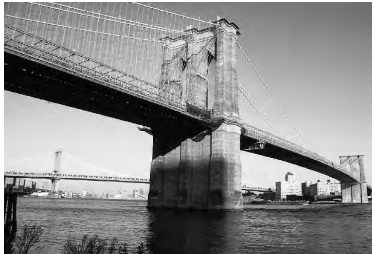
Fig. 2. Puente de Brooklyn. Nueva York. 1883. J. Roebling. Luz 468 m.

debido a la aparición de nuevos materiales y al origen del conocimiento teórico del comportamiento resistente de las estructuras, llevó a la disociación de las dos profesiones.