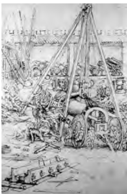
Fig. 14. Transporte de un cañón. Dibujo de Leonardo da Vinci. Fig. 15. Máquina de vuelo. Dibujo de Leonardo da Vinci. Fig. 16. Fachada principal del Museo del Prado. Juan de Villanueva. S. XVIII.

Un buen ejemplo de su forma de trabajo es su estudio sobre el comportamiento a flexión de la viga, que se encuentra en el Código de Madrid I . En este estudio LEONARDO planteó que la fibra superior, es decir, la más próxima al centro de curvatura de la deformada, se acorta, la inferior se alarga, y la fibra media no varía de longitud. La deformación de las fibras intermedias es proporcional a su distancia a la fibra media. LEONARDO, como en tantos otros temas, se limitó a esta descripción, sin intentar cuantificar el fenómeno. El primero que intentó llegar a un conocimiento científico de la flexión fue GALILEO GALILEI, que estudió la viga apoyada y la ménsula; pero su hipótesis sobre la distribución de tensiones en la sección de la viga debidas a la flexión, están mucho más lejos de la realidad que las intuiciones de LEONARDO (15).