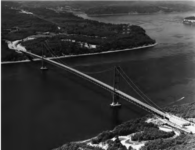
Fig. 32. Segundo puente del Estrecho de Tacoma cerca de Seattle EEUU. 1948. D.R. Smith, N.E. O'connor, y E.H. Thomas. Luz 853 m.