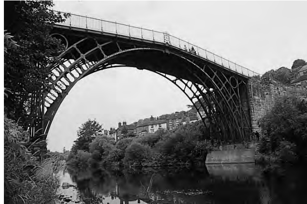
Fig. 22. Puente de Alcántara sobre el río Tajo. Prov. De Cáceres. C.J. Lacer. S. II. Fig. 23. Puente de Coalbrookdale sobre el río Severn, Inglaterra. T.F. Pritchard Arq. A. Darby III fundidor. J. Wilkinson maestro de fundición. 1779.

de San Fernando la formación de los arquitectos era muy tradicional, basada fundamentalmente en un conocimiento histórico de la arquitectura, en los órdenes arquitectónicos, y con un conocimiento mínimo de las técnicas de construcción y de los materiales. En la Escuela de Ingenieros de Caminos y Canales , en cambio, se hacía énfasis en la formación científico-técnica, partiendo de una amplia formación de matemáticas. Era el arte, tal y como se definía en aquel momento, frente a la técnica emergente. Podemos decir que en la enseñanza de la arquitectura dominaba su historia; en cambio la enseñanza de la ingeniería, que se consideraba una profesión nueva, se basaba casi exclusivamente en una formación científico-técnica.